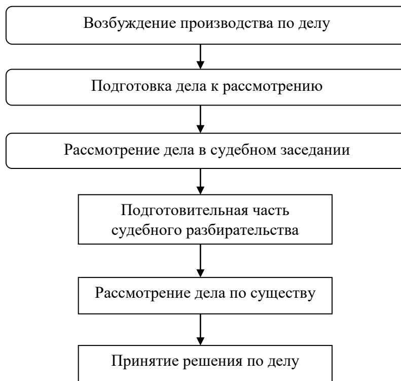
Схема 2 – Стадии конституционного судопроизводства.