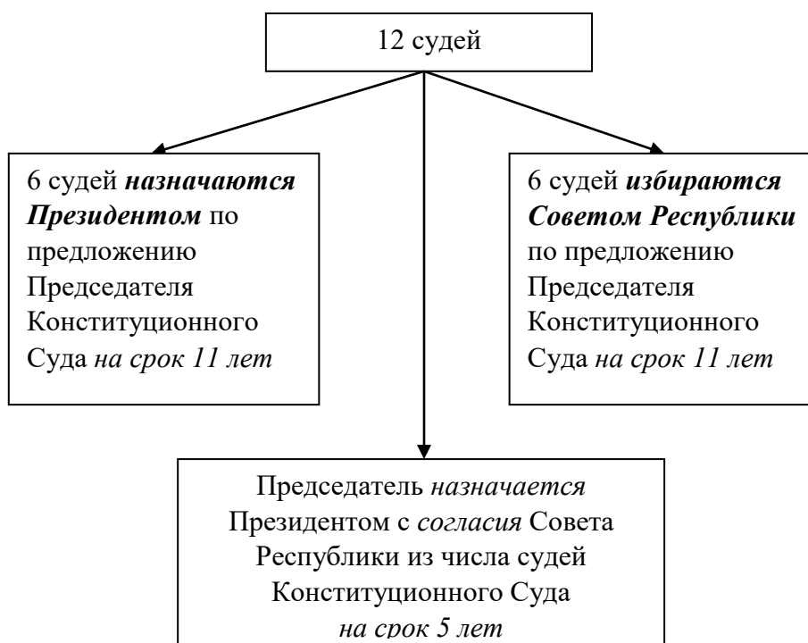
Схема 1 – Порядок формирования Конституционного Суда Республики Беларусь.